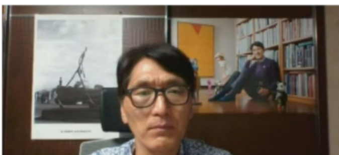
So Jinsu, estrarano

Laboras pri Eŭropa agado, Ĝemelaj Urboj ka.