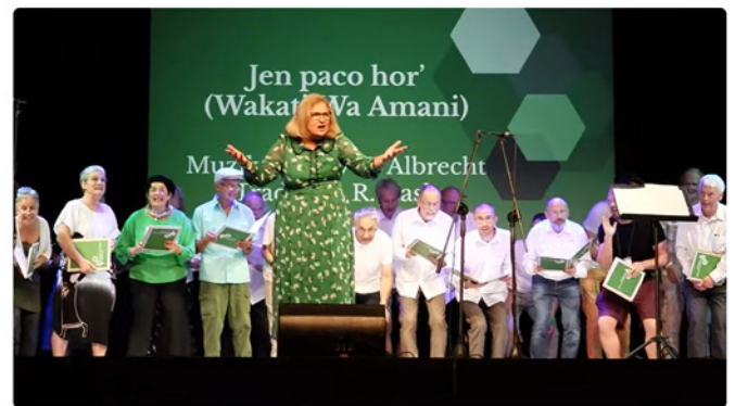
108-a Universala Kongreso de Esperanto, Torino, Italio, 2023.7.29-8.5.