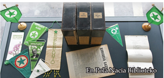
En Pola Nacia Biblioteko