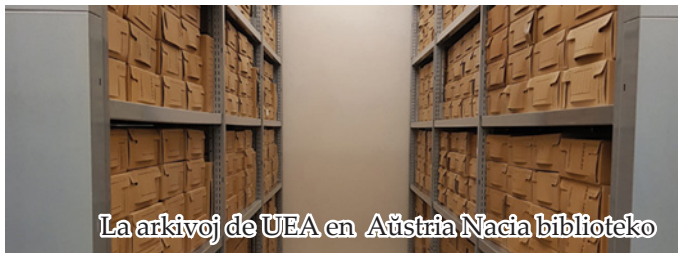
La arkivoj de UEA en Aŭstria Nacia biblioteko

Ne estingiĝas la demandoj pri la estonteco de la Biblioteko Hodler kaj Centra Oficejo. La biblioteko trovis novan hejmon en la sino de la Pola Nacia Biblioteko (pli detale legu en la revuo Esperanto n-ro 7-8 de la jaro 2023), kaj la arkivoj de UEA restas en Aŭstria Nacia